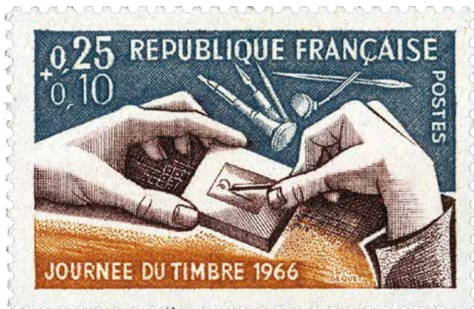
Timbre : Journée du timbre 1966 © Dessiné et gravé par Pierre Béquet

Mais ces propositions ne peuvent toutes être satisfaites. Seule une cinquantaine de