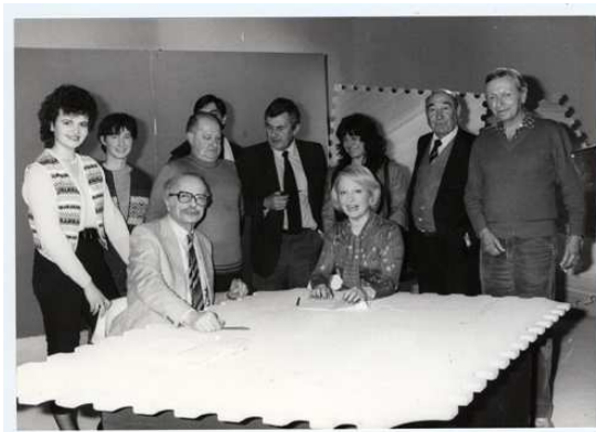
L'équipe du magazine lors de la dernière émission en avril 1983