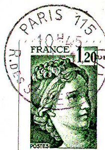
Flamme d'oblitération temporaire « 20 ans de Philatélie – TF1 », 1981. Utilisée dans 3 bureaux de Poste de Paris pour les 20 ans du magazine philatélique à la télévision (Inv.2010.114.3)