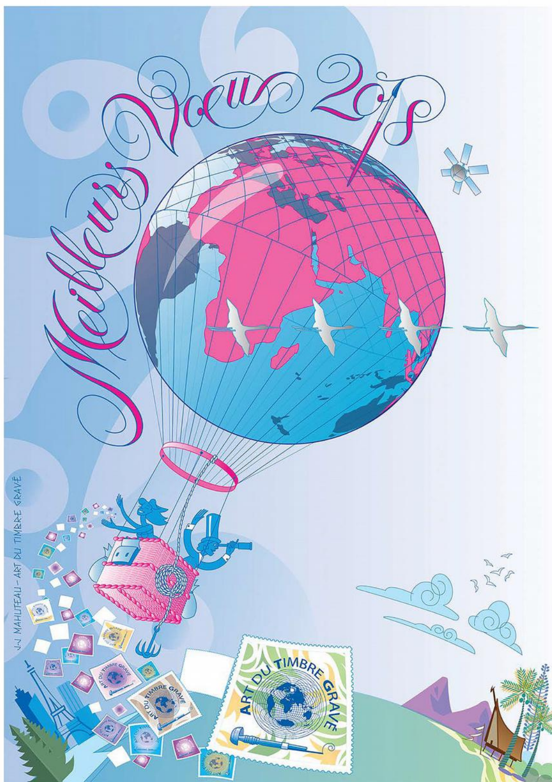
La carte de vœux virtuelle de l'ATG 2018 est illustrée par Jean-Jacques Mahuteau. C. ATG/JJ.Mahuteau

Elsa, Laurence, Monika, Sophie, Joël et Pascal du Bureau du Conseil d'administration Vous souhaitent une très bonne année 2018