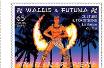
7 La danse du feu