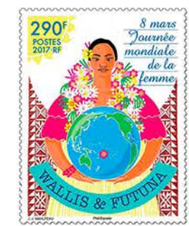
9 Journée mondiale de la femme