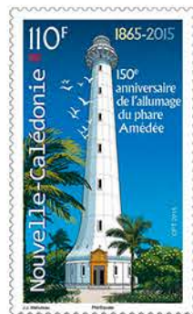
5 150 e anniversaire de l'allumage du Phare Amédée

Depuis 2008, l'aventure continue en Nouvelle-Calédonie pour la conception de timbres-poste, dont six réalisations pour l'horoscope chinois 3 , le Musée Maritime de Nouvelle-Calédonie, l'hommage au Docteur René Catala et les 70 ans de l'IRD 4 , les Jeux du Pacifique NC 2011, les Championnats du monde de natation sport