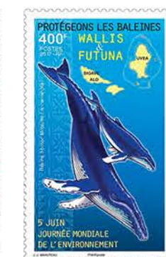
10 Protégeons les baleines