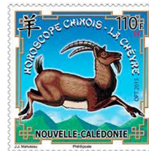
3 Horoscope Chinois - La Chèvre