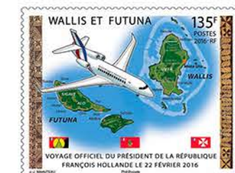
2 Voyage officiel du Président de la République François Hollande. (Maquette refusée)

adapté, les jeux traditionnels kanaks, la Journée mondiale du donneur de sang, le 4 e Festival des Arts mélanésiens, le 150 e anniversaire de l'allumage du Phare Amédée 5 , les paquebots de légende 6 , l'art du bonsaï, les associations Alliance Champlain et 1 arbre, 1 jour, une vie, ainsi que le thème de Noël et le bloc-feuillet sur les hérons de Nouvelle-Calédonie. Figurent également à mon actif la conception de nombreux timbres-poste personnalisés et des PAP.