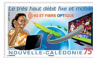
1 Le très haut débit fixe et mobile. (Maquette refusée).